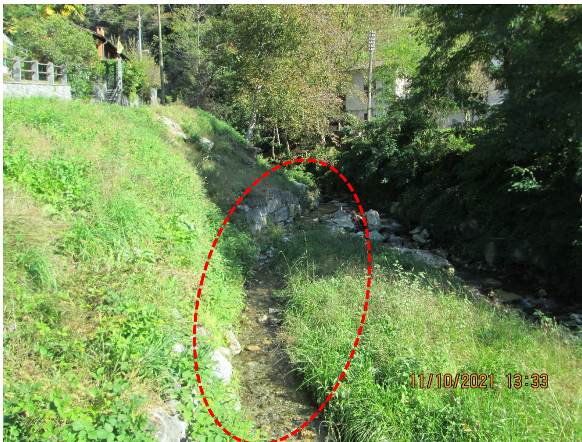
Situazione finale dopo ripristino