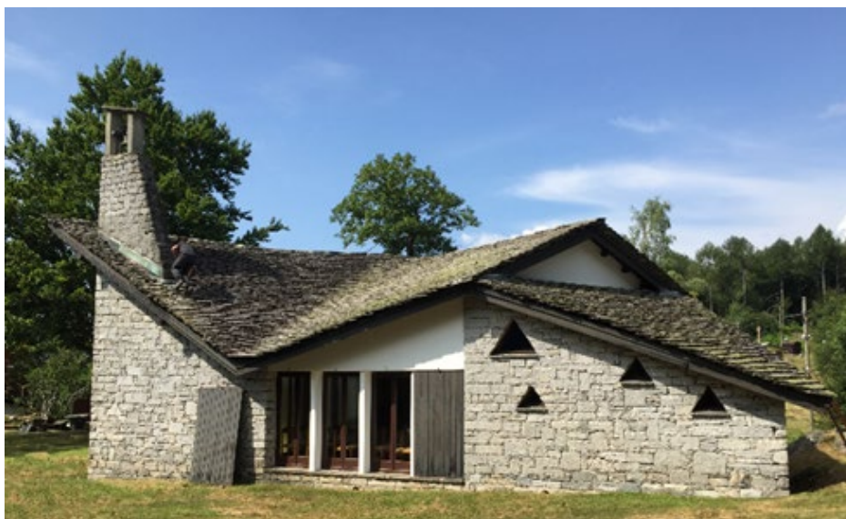
Oratorio Monti Motti