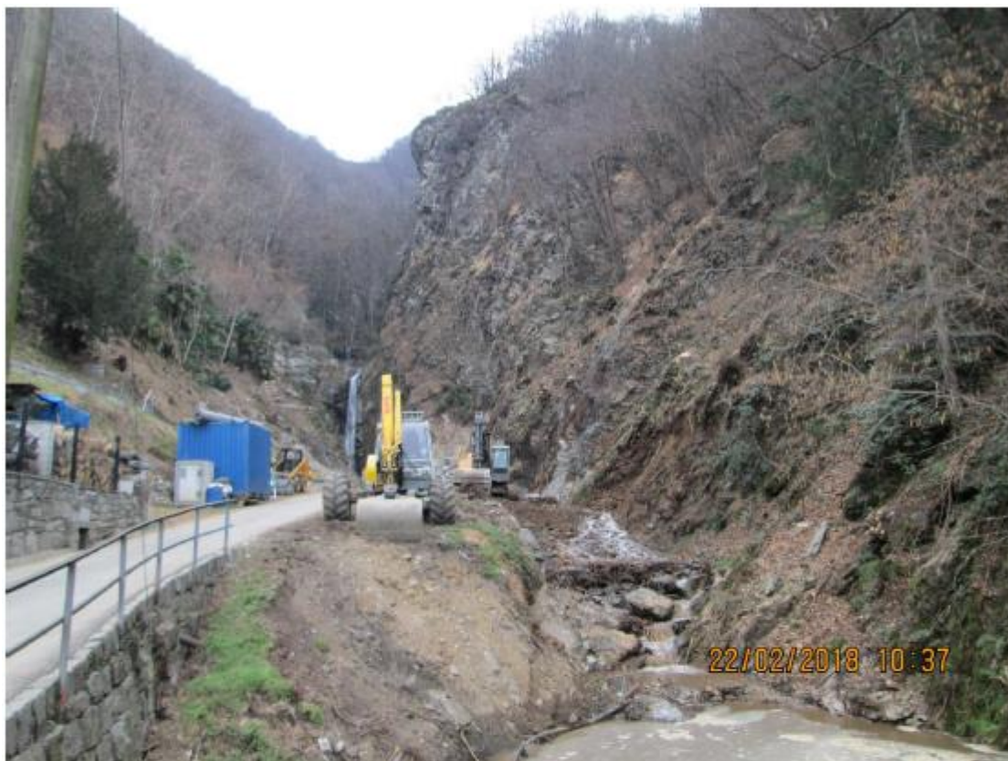
1. Lo stato della sponda sinistra del Riale Carcale il 22 febbraio 2018, in seguito ai lavori di taglio della vegetazione e pulizia del pendio.