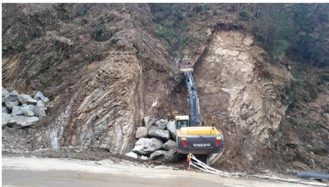
2. La situazione del pendio in seguito al primo dissesto avvenuto il 24-25 febbraio 2018.