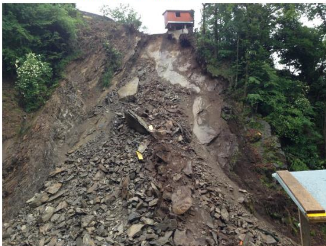
8. La situazione in seguito al crollo principale del 20 maggio 2018, che ha coinvolto un volume di ca. 2'000 m 3 di roccia.