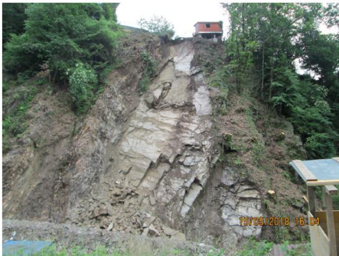
6. Il crollo parziale del 15 maggio ha coinvolto ca. 150 m 3 di roccia nella parte superiore.