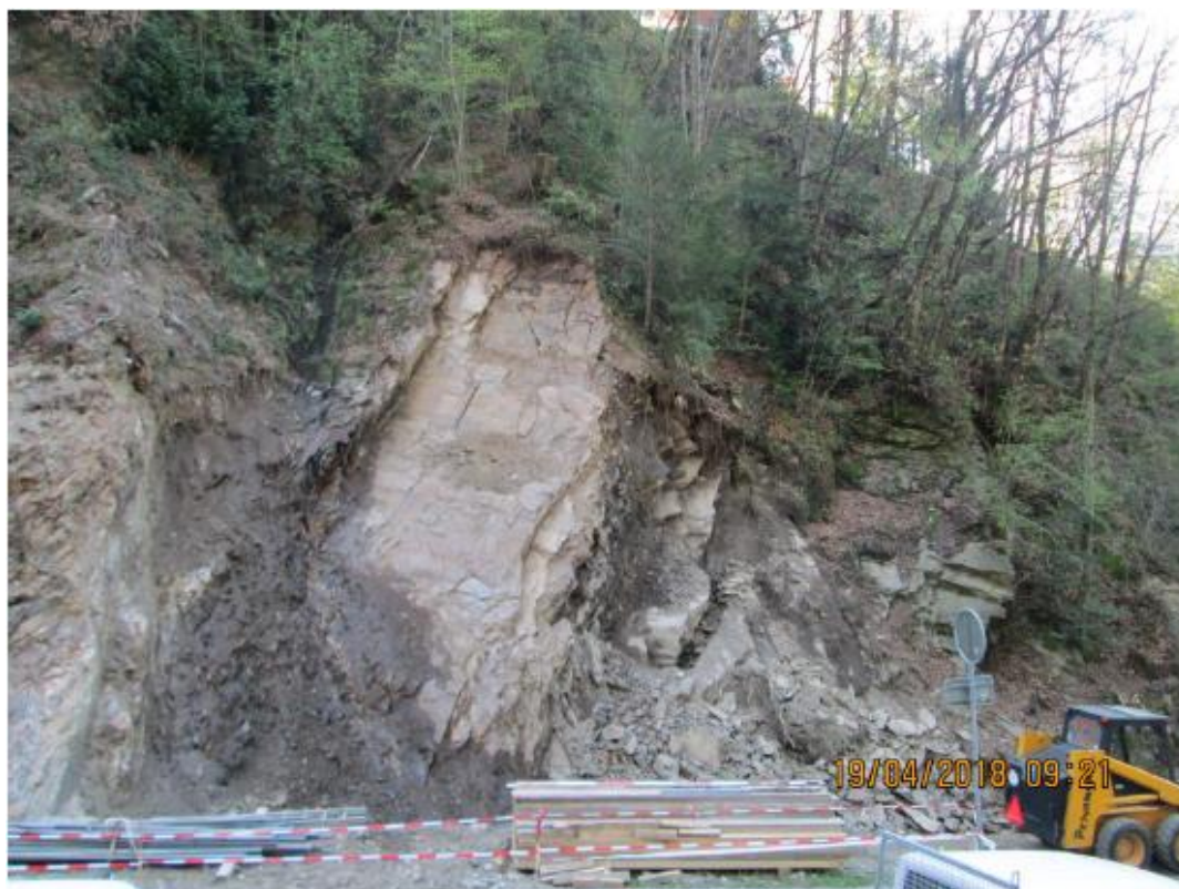
3. La situazione dopo il secondo dissesto del 14-15 aprile 2018.