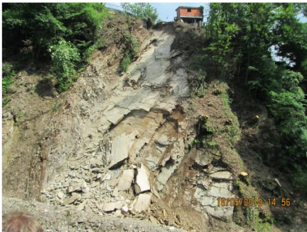
7. Il crollo parziale del 18 maggio 2018, nella parte centrale del pendio.