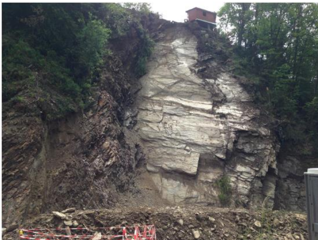
5. La situazione il 4 maggio 2018, al termine dei lavori di sgombero del materiale detritico.