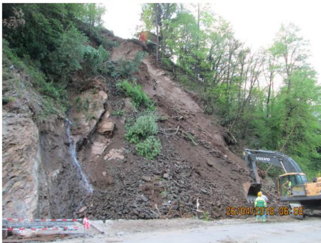
4. L'importante dissesto del 26 aprile 2018 ha coinvolto l'intero versante ostruendo l'alveo del Carcale.