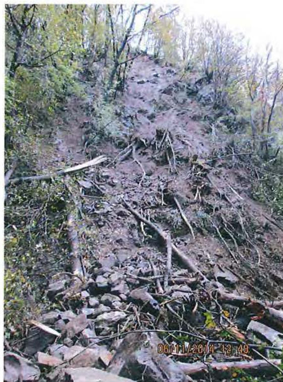
5. Vista parte alta franamento