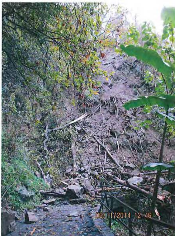
4. Vista generale franamento