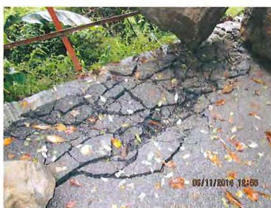
7. Manto stradale da ripristinare