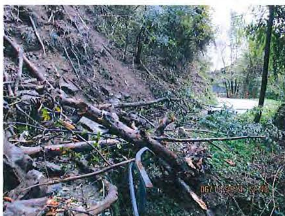
6. Barriere stradali distrutte