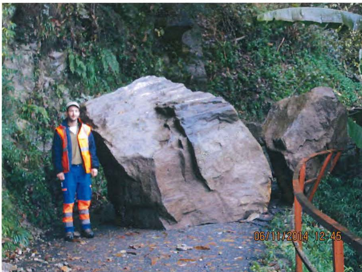
1. Massi caduti sulla strada sopra condotta AAP