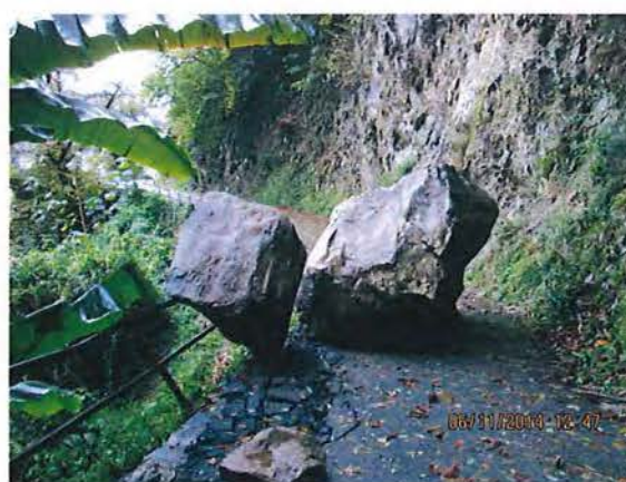
3. Vista da monte massi foto 1.