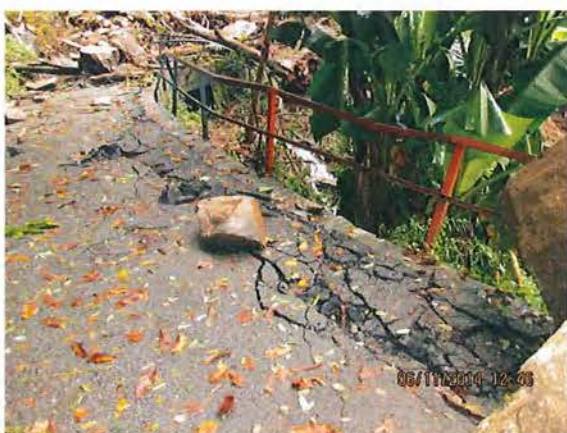
2. Situazione manto stradale