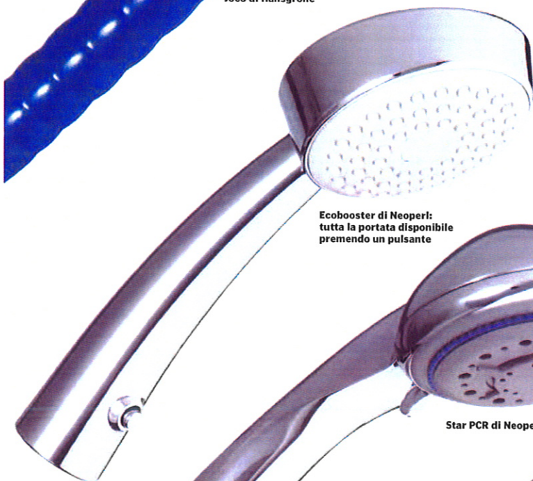
Ecobooster di Neoperl: tutta la portata disponibile premendo un pulsante