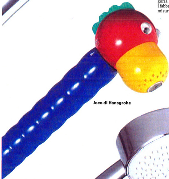
Joco di Hansgrohe