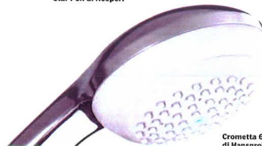
Crometta 685 Green di Hansgrohe

dell'introduzione dell'etichettaEnergia. All'interno delle famiglie di prodotti esistono anche sempre più modelli efficienti e super efficienti caratterizzati dallo stesso design attraente.