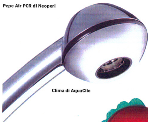
Clima di AquaClic