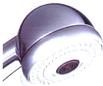
Pepe Air PCR di Neoperl

Divertimento, costi e ambiente sono tutti fattori che possono essere riuniti sotto un comune denominatore grazie alle tecnologie odierne: soffione doccia energeticamente efficiente della Hansgrohe.